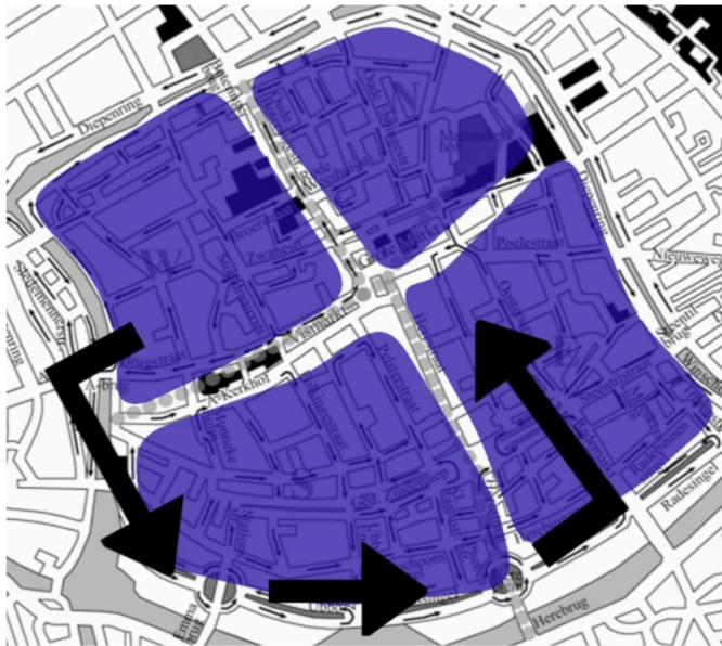
Prinzip der gefilterten Durchlässigkeit im Innenstadtbereich Groningen , Umweg für den MIV – Grafik: Streetfilms