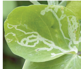
So sieht ein Fraßgang in einem Blatt aus