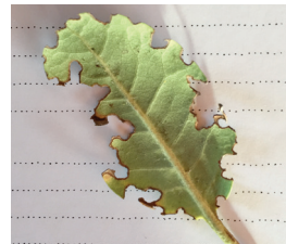
... und hier hat jemand am Rand geknabbert!